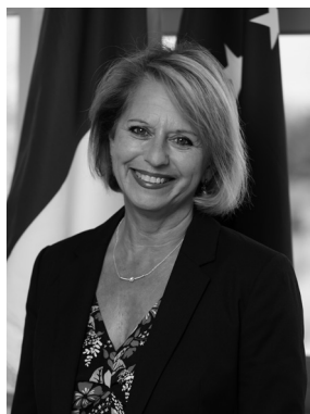
→ BRIGITTE BOURGUIGNON MINISTRE DÉLÉGUÉE EN CHARGE DE L'AUTONOMIE AUPRÈS DU MINISTRE DES SOLIDARITÉS ET DE LA SANTÉ

Depuis près d'un an, cette crise sanitaire nous met collectivement à l'épreuve. Les personnes âgées, qu'elles vivent en établissement ou à domicile, mais aussi l'ensemble des professionnels du grand âge, les familles et les aidants ont été particulièrement éprouvés par la violence de cette crise.